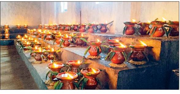
मुरकुची ग्राम में स्थापित नृसिंह मंदिर में पिछले 25 वर्षों से मनोकामना ज्योत श्रद्धालुओं के द्वारा जलाया जा रहा है। मंदिर

हरिभूमि न्यूज ▶▶ भानपुरी नवरात्र के अवसर पर क्षेत्र के मंदिरों में श्रद्धालुओं ने मनोकामना ज्योत कलश प्रज्वलित किया है। शीतला माता मंदिर भानपुरी, दंतेश्वरी मंदिर केशरपाल व नृसिंह मंदिर मुरकुची को भव्यता से सजाया गया है। ग्रामीणों के सहयोग से क्षेत्र में दुर्गा मां की मूर्ति स्थापित कर नौ दिनों तक नवरात्र पर्व मनाने की परंपरा क्षेत्र में विधिवत जारी है।